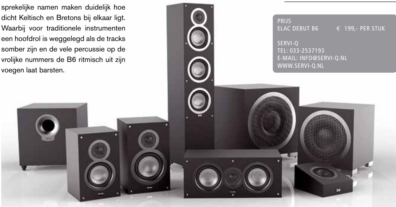
COMPLETE DEBUT SERIE

SERVI-Q TEL: 033-2537193 E-MAIL: INFO@SERVI-Q.NL WWW.SERVI-Q.NL