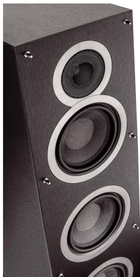
Der Hochtöner sitzt hinter einem Metall-Schutzgitter. Zur Anpassung des Frequenzgangs dient ein angeflanschter Waveguide

Labor Vor unserem Messmikrofon geben die Elac-Lautsprecher Debut F5 ein ausgewogenes Bild ab. Ab etwa 45 Hertz ist die schlanke Bassreflexbox am Ball und verläuft linear mit einem mittleren Wirkungsgrad von 85 dB/1 W/1 m bis hinauf zu sechs Kilohertz. Ab da fällt der Pegel dezent ab. Das Abstrahlverhalten ist sehr gut, auf Achse und unter 15 Grad betrachtet sind die Amplituden nahezu identisch. Bis auf wenige Restresonanzen zeigt sich auch das Wasserfalldiagramm unauffällig. Der gutmütige K2-Klirrfaktorwert knackt bei rund 500 Hertz die 2-Prozent-Marke, bleibt ansonsten aber unter der magischen 1-Prozent-Linie. K3 zeigt ebenfalls einen kleinen Ausreißer bei 1,5 kHz, bleibt aber ansonsten allzeit im grünen Bereich.